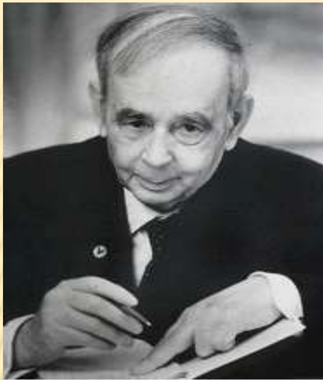
І.Є. Тамм Фізик-теоретик, лауреат Нобелівської премії, професор Таврійського університету