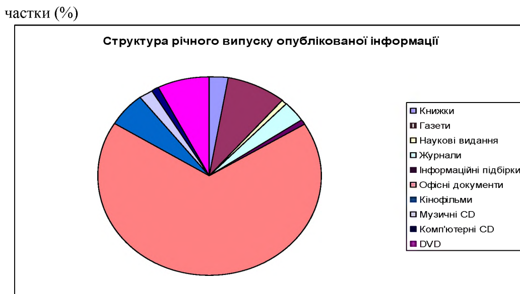
Рис. 1.3. Структура річного випуску опублікованої інформації [5, с.135]

Зразок оформлення рисунку в магістерській кваліфікаційній роботі: