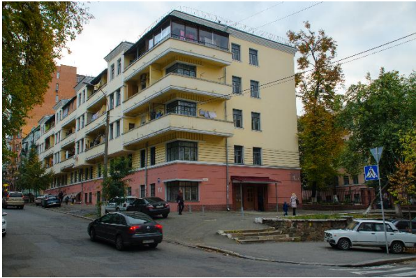
Іл. 2. Корпус № 1 гуртожитку Польського педагогічного інституту. Збудований 1935 р.

Будівництво розпочалося навесні 1934 р., тривало впродовж 1935 р. та