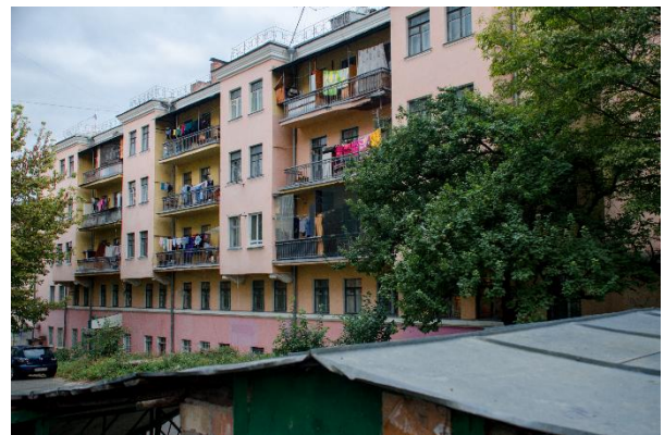
Іл. 3. Корпус № 2 гуртожитку Польського педагогічного інституту. Збудований 1935 р.

У цілому ж корпуси гуртожитків з'явилися в строк. Втім, через політичні мотиви та подальші репресії [6; 4], Польський інститут так і не був споруджений повністю. Невдовзі після зведення, нові будівлі гуртожитків передали в розпорядження Вищої партійної школи. Будівництво навчального корпусу теж було розпочато, але, на жаль, не закінчено в повному обсязі. З усієї запроектованої великої, Ш-подібної в плані будівлі було споруджене тільки її ліве крило, де пізніше розмістили видавництво «Радянська школа» [12]. Смілива, енергійна архітектура цієї рідкісної 3–5-поверхової будівлі, яка сьогодні знаходиться по вул. Володимира Винниченка, 5 (Іл. 4), дає уявлення про заплановану неор-