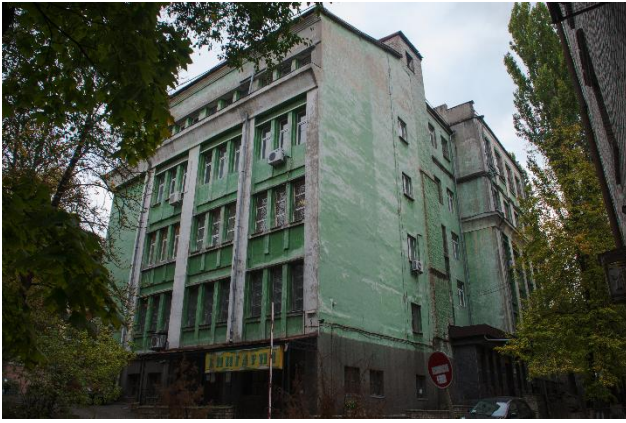
Іл. 4. Ліве крило навчального корпусу Польського педагогічного інституту. Збудоване 1935 р.

ною адресою знаходиться по вул. Володимира Винниченка, 7 [12] (Іл. 5). Нині, разом із мешканцями, у ньому також розмістились такі організації, як: «Українська страхова група» [26], «Київська факторингова компанія» [24], «Вектор-констракт інжинірінг», «Енерджі ойл компані», «Геліос сек'юріті груп» [16] та ін [18; 20; 17; 1].