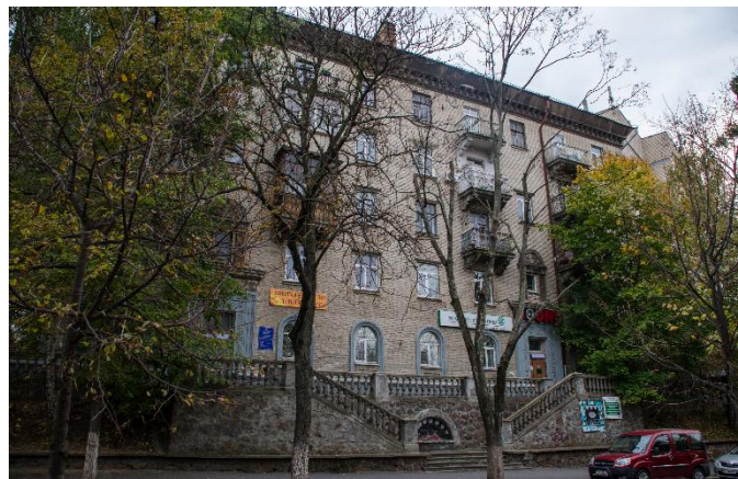
Іл. 5. Житловий будинок, збудований після війни на ділянці, куди повинен був продовжуватись фасад навчального корпусу Польського педагогічного інституту

динарну споруду, що характерно демонструє кращі риси стилю раннього радянського конструктивізму, яку, на жаль, нам не судилося побачити збудованою повністю [19, с. 60]. Вже після війни, на ділянці, куди повинен був продовжуватись фасад навчального корпусу, з'явився новий житловий будинок у стилі сталінського ампіру, з ефектними сходами, який за теперіш-