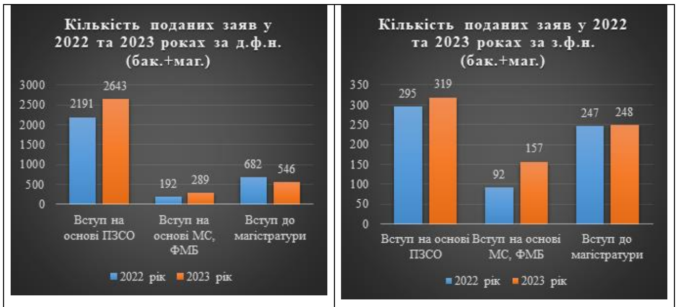
Рис. 1. Динаміка поданих заяв за денною і заочною формами навчання

Зокрема, у порівнянні з 2022 році кількість поданих заяв до вступу за ОС "Бакалавр" у 2023 році було збільшено на 476 заяв (19,1 %).