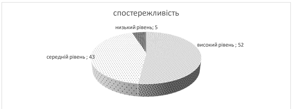
Рис.4.1 Розподіл рівнів спостережливості у студентів першого курсу (%)

Наприклад, відсотковий розподіл рівнів прояву аналізованої ознаки у вибірці наочно може бути представлено з допомогою діаграми (рис. 4.1).