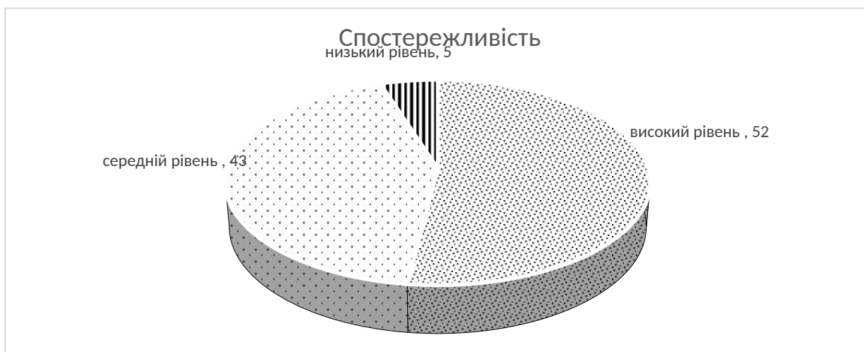
Рис.4.1 Розподіл рівнів спостережливості у студентів першого курсу (%)

Наприклад, відсотковий розподіл рівнів прояву аналізованої ознаки у вибірці наочно може бути представлено з допомогою діаграми (рис. 4.1).