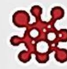
СПИСУВАННЯ ПИСЬМОВИХ РОБІТ ІНШИХ СТУДЕНТІВ