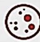
КОПІЮВАННЯ ЧУЖОЇ НАУКОВОЇ РОБОТИ ТА ПРИВЛАСНЕННЯ РЕЗУЛЬТАТІВ ПРАЦІ