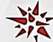
ЗГАДУВАННЯ ДЖЕРЕЛА БЕЗ ПОСИЛАННЯ

Плагіат можна умовно розділити на два типи: умисний та неумисний.